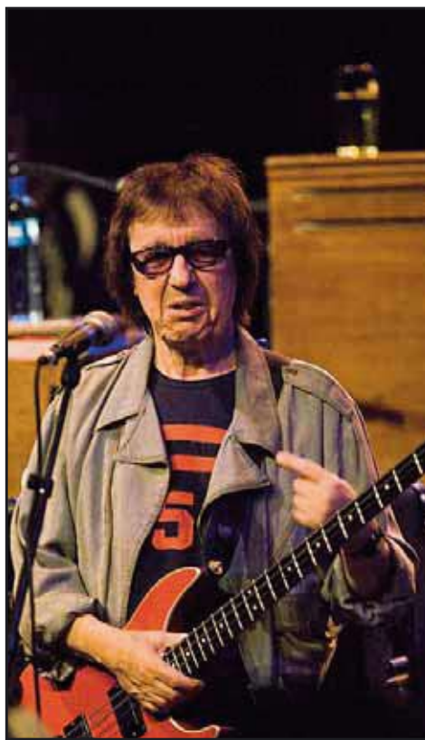
- Okay, vi spiller ingen Stones-låter. Egentlig